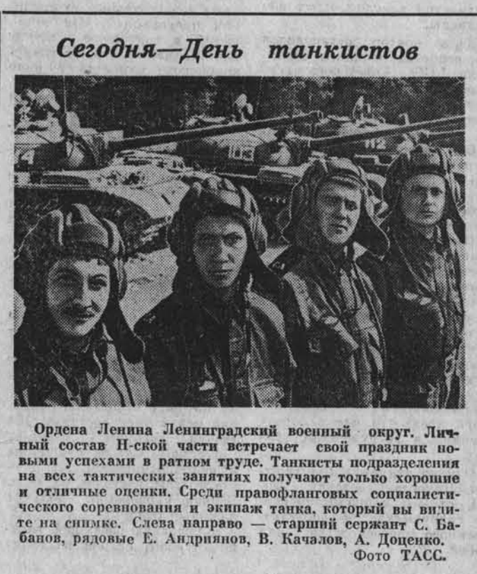
Сегодня — День танкистов