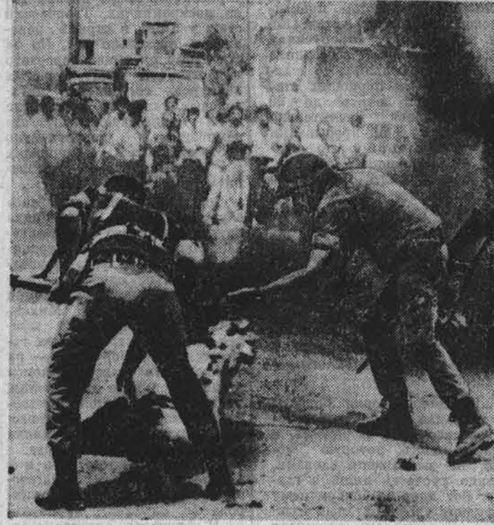
Израильские оккупанты продолжают подготовку к перемещению своей армии в Ливан. В южных районах и на средиземноморском побережье страны оккупанты занимают дома местных жителей, переселяют их в казармы для своих войск.