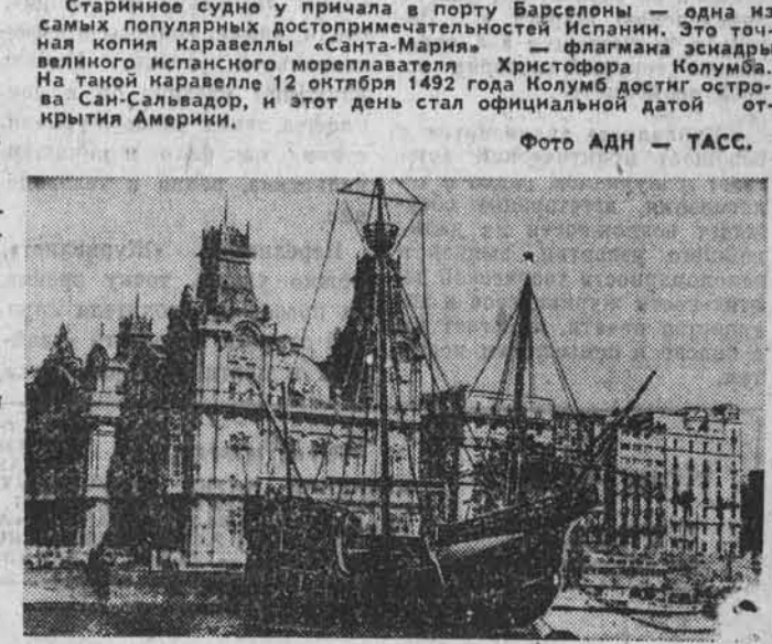
Старинное судно у причала в порту Барселоны — одна из самых популярных достопримечательностей Испании. Это точная копия каравеллы «Санта-Мария» — флагмана эскадры великого испанского мореплавателя Христофора Колумба. На такой каравелле 12 октября 1492 год Колумб достиг островов Сан-Сальвадор, и этот день стал официальной датой открытия Америки.