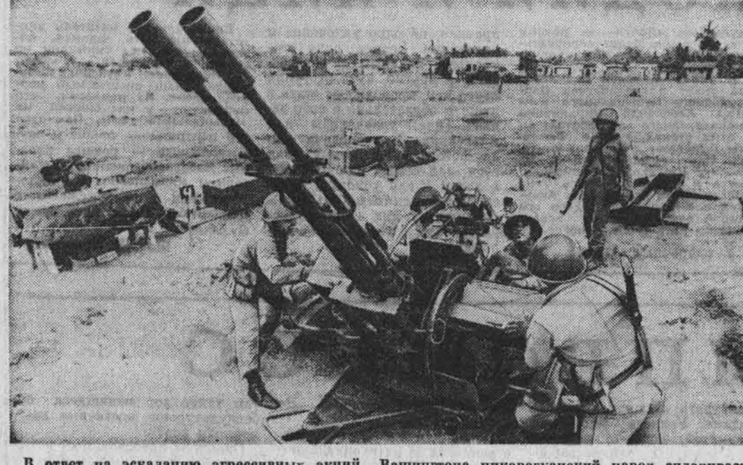
В ответ на эскалацию агрессивных акций Вашингтона никарагуанский народ спланирует свои ряды и нанесет сокрушительные удары по наемникам империализма. НА СИМБЕ; зенитчики Сандинистской народной армии во время боевой подготовки.

С 1958 года над островами Бикини и Энвиекет не гремит ядерные взрывы. Но их зловещая тень по-прежнему тянется над несколькими тысячами жителей островов — наглядный пример того, как мгновенно можно навсегда опустошить любой райский уголок на земле.