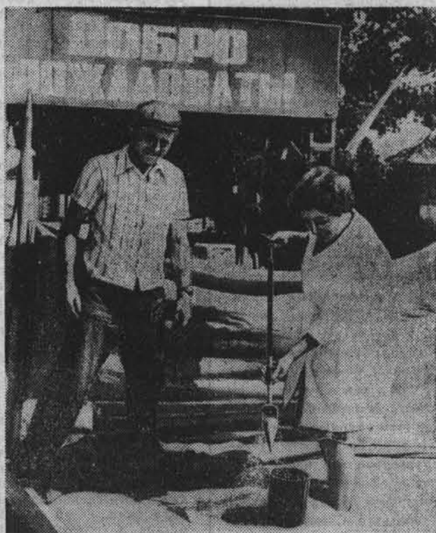
План хлебосдачи — закон, перевыполнение — доблесть!

▲ Земледельцы Троицкого района поставили задачу выполнить план продажи зерна государству, засыпать в закрома 32.500 тонн хлеба, а также погасить часть задолженности, допущенной с начала пятилетия.