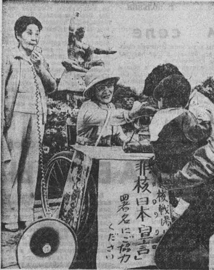
ЯПОНИЯ. Движение за запрещение ядерного оружия и разоружение приобретает все более широкие масштабы в стране.

ЛОНДОН. (ТАСС). Консервативный кабинет М. Тэтчер продолжает форсированными темпами наращивать военное строительство на Фолклендских островах, превращая архипелаг в мощный стратегический форпост Британии в Южной Атлантике. Министр обороны Англия М. Холдгейн официально объявил о планах строительства на Фолклендах нового крупного аэродрома. На эти цели военное ведомство намерено выделить более 215 млн. фунтов стерлингов. По замыслу Лондона, аэродром будет выполнять роль опорной базы для создаваемой в настоящее время Британской так называемых «сил быстрого развертывания». Они формируются Англией по образцу уже существующих американских сил подобно-