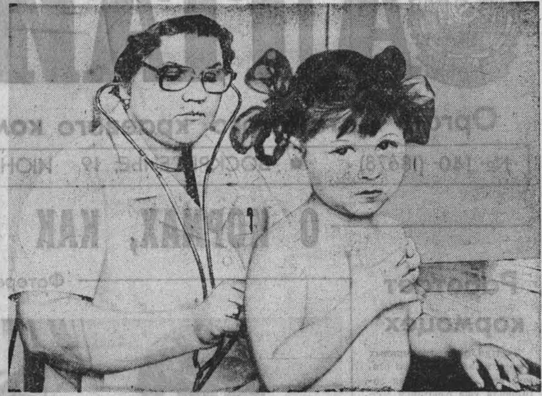
ЛЮБОВЬ К ПРОФЕССИИ