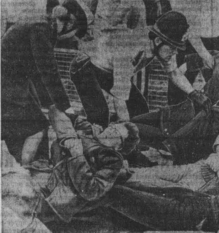
АНГЛИЯ. Несколько сот человек со всех концов страны прибыли в ворота военно-воздушной базы США в местечке Аппер-Хейфорд (графство Оксфордшир), на которой размещены американские истребители-бомбардировщики «Ф-111», оснащенные ядерным оружием. Инициаторами этой манифестации протеста стали жители созданного в базе палаточного «лагеря мира» и местные отделения массовой общественной организации — Движение за ядерное разоружение. Пытаясь сорвать выступление сторонников мира, власти прибегли к репрессиям. Среди участников демонстрации в Аппер-Хейфорде проведены аресты. НА СНИМКЕ: во время разгона манифестации протеста. Телерадио ЮИИ — ТАСС.