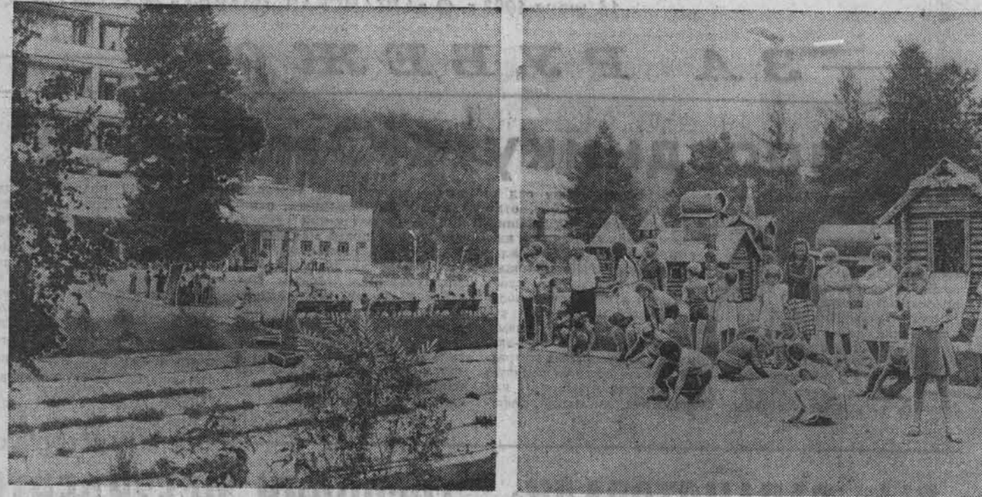
КУРОРТ «БЕЛОКУРИХА». САНАТОРИЙ МАТЕРИ И РЕБЕНКА.

33-50 проц. заработка. Учащиеся строительных специальностей на курсе, кроме месячной стипендии, получают в течение учебного года стипендию в размере 20 руб. Окончившим выдается аттестат о присвоении разряда по специальности.