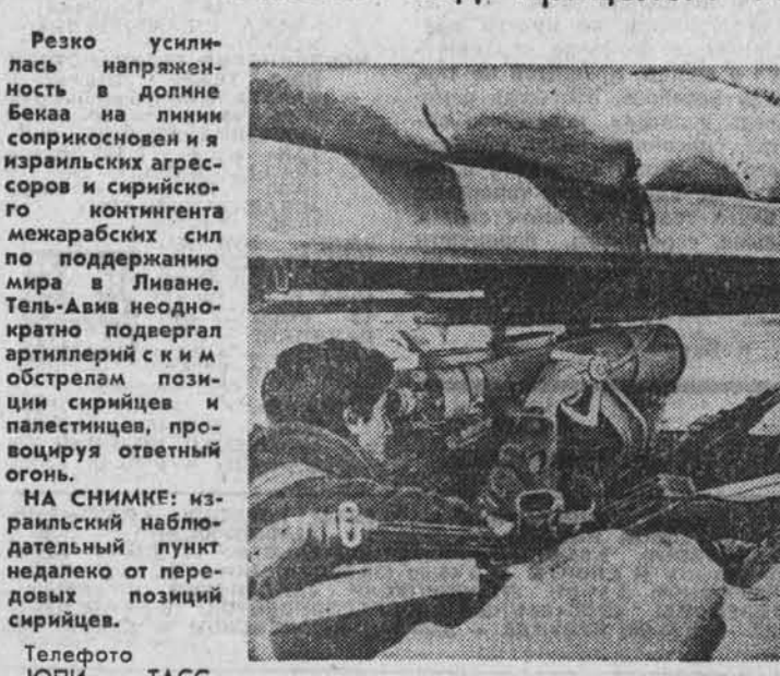
Резко усилилась напряженность в долине Бека на линии соприкосновения и израильских агрессоров и сирийского контингента межабарских сил по поддержанию мира в Ливане. Тель-Авив неоднократно пригрозил поддержать артиллерийские и м обстрелы с позиций сирийцев и палестинцев, преследуя ответный огонь. НА СНИМКЕ: израильский наблюдательный пункт недалеко от передовых позиций сирийцев.

В выпуске использованы материалы ТАСС, АПН, журнала «Новое время».