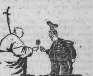
Где-то в Центральной Америке: — Благодаря вас, но где же тут сушевой кричток? «Сан-Франциско кривляк».

Идеологическая обработка военнослужащих латиноамериканских армий осуществляется не только Пендагоном, но и целой сетью министерств, отдельных факультетов и пелых университетов, которые готовят социологов, политологов, психологов, лингвистов — словом, тех, кто претворяет в жизнь новую доктрину Вашингтона.