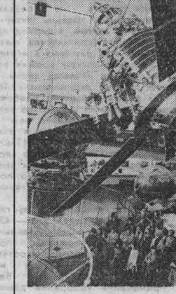
Калуга. Государственный музей истории космонавтики имени К. Э. Циолковского зримо рассказывает об истории освоения космического пространства. Музей стал научно-исследовательским, культурно-просветительным учреждением, пропагандирующим идеи К. Э. Циолковского и демонстрирующим достижения космонавтики. На снимке: экспонаты этого зала рассказывают о претворении в жизнь идей К. Э. Циолковского.