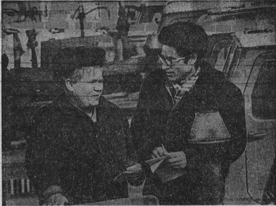
Детально идет подготовка к севу в колхозе «Москва» Хабаровского района. Не стоят в стороне и народные дозорные. Они постоянно следят за темпами и качеством ремонта техники.

Уверена, что дозорные нашего совхоза умножат вклад в экономическое и социальное развитие предприятия, в реализацию Продовольственной программы страны.