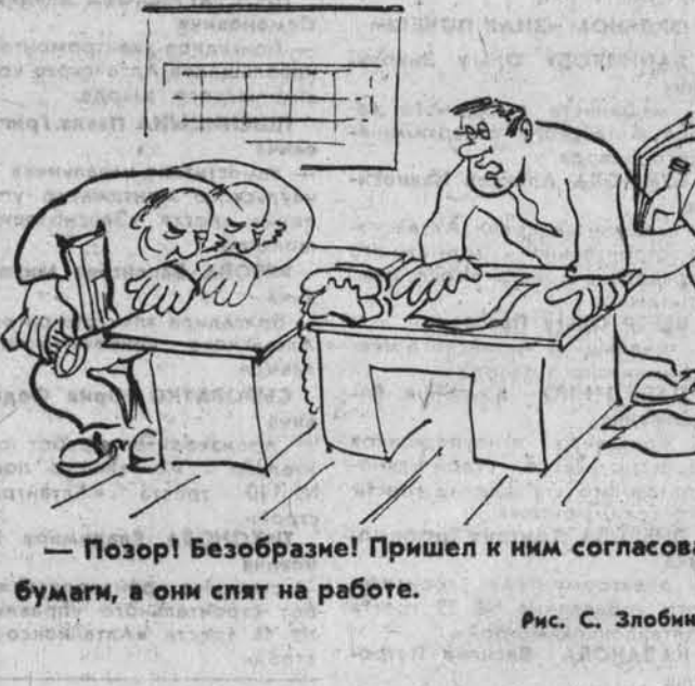
— Позор! Безобразия! Пришел к ним согласовать бумаги, а они спят на работе.

Как показала проверка режима работы предприятий, организаций и учреждений райцентра Усть-Кокса, здесь еще много неурядиц. Нет четкого контроля за выходом на работу, табели ведутся не ежедневно. Народные контролеры обнаружили 17 опозданий на работу, два человека пытались трудиться в нетрезвом виде, 47 человек в рабочее время посещали магазины, сберкассу, КБО и т. д.