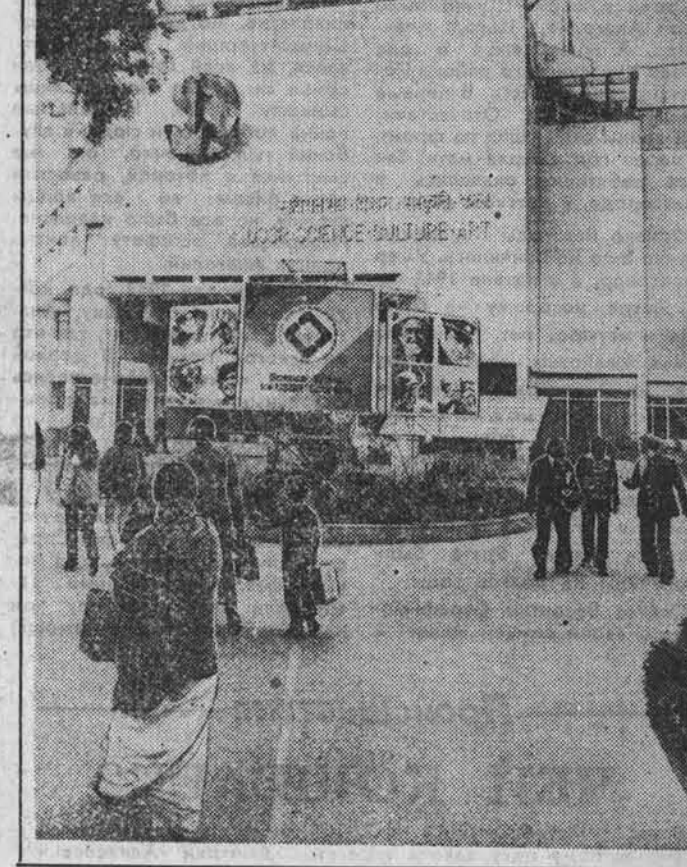
ДЕЛИ. Дни советской науки и техники — одно из знаменательных событий в жизни индийской столицы. При переполненных залах проходят лекции советских специалистов о развитии науки в СССР, об использовании ее достижений в различных областях экономики. Открывающаяся здесь выставка «Наука — народному хозяйству СССР» в первый же день ее работы посетили тысячи индийцев. На снимке: общий вид Дома советской науки и техники, в котором развернута выставка.

А. ПРАВОВ, спец. корр. АПН. Иваново — Москва.