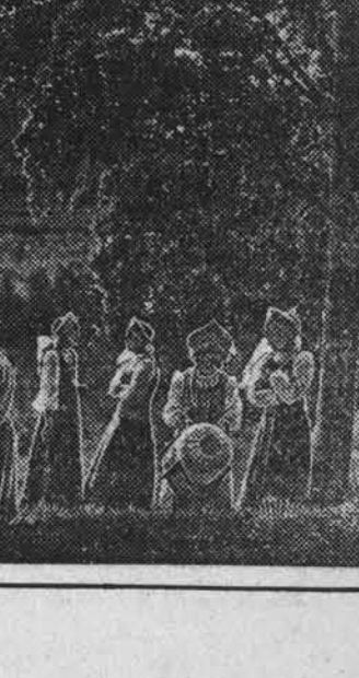
Вологодская область. Развитие старинного искусства плетения иржуев (на снимке). Оно достигло тысячелетней истории, работая в объединении «Сивинская». Их оригинальные изделия, отличающиеся богатством узоров и тонкостью исполнения, восхищаются зрителями на отечественных и зарубежных выставках.

В Вологодской области развивается старинное искусство плетения иржуев (на снимке). Оно достигло тысячелетней истории, работая в объединении «Сивинская». Их оригинальные изделия, отличающиеся богатством узоров и тонкостью исполнения, восхищаются зрителями на отечественных и зарубежных выставках.