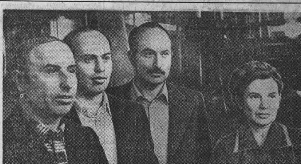
Лауреаты премии имени...