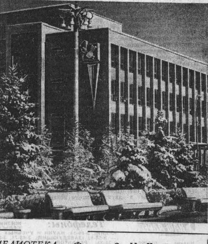
«КРАЕВАЯ БИБЛИОТЕКА».

Таких магазинов, как наш, в индустриальном районе Барнаула, нет. У нас есть комнаты отдыха и бытовые, хорошие административные, складские помещения. Работаем мы по методу самообслуживания. Наш магазин универсальный: реализует общественно-политическую литературу, книги по искусству, музыке, медицине и другие.