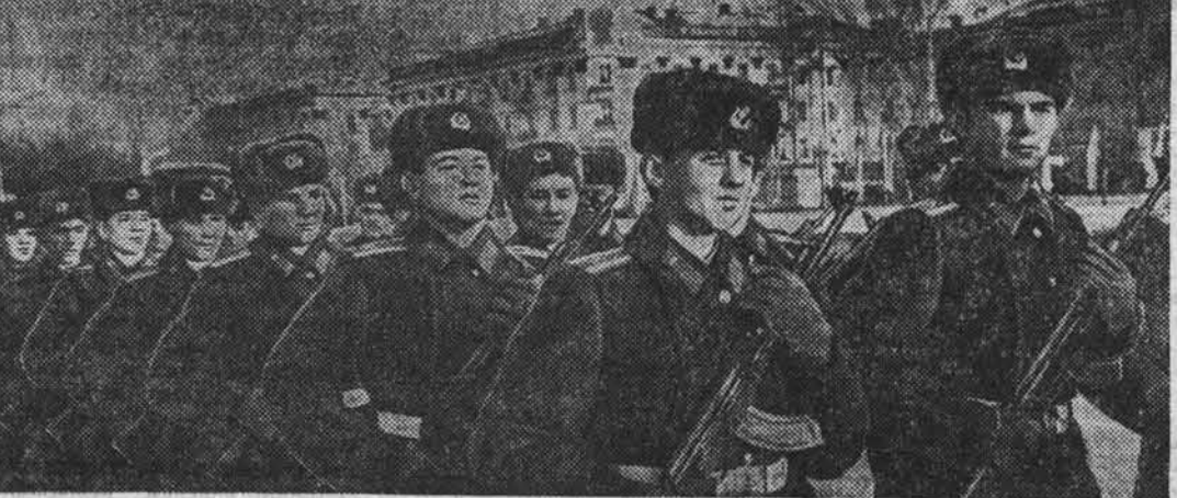
НА СНИМКАХ — праздничные шествия барнаульцев: одна за другой проходят по площади Советов колонны трудящихся, они рапортуют о своих успехах — им есть чем гордиться; курсанты авиационного училища несут флаги всех союзных республик; хорошее настроение у участников демонстрации.