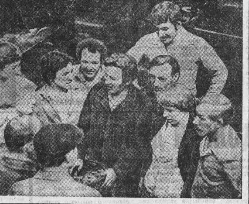
Сегодня — День машиностроителя