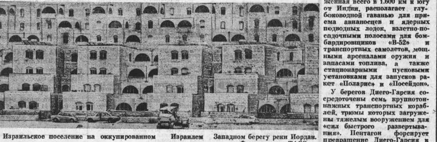
Иранское поселение на оккупированном Иранском Западном берегу реки Иордан.

ОПРОВЕРЖЕНИЕ ФАЛЬШИВКИ ХАНОН. (ТАСС). Вьетнамское информационное агентство ВНА опровергло известия о якобы раскрытии японского агента в Камбодже. Число, что вьетнамские якобы скомпрометировали войска на маньчжурско-тайландской границе. Подобные распространяемые постоянно фальшивки, отмечает ВНА, направлены на то, чтобы скомпрометировать добрую волю Вьетнама, решившего вывести определенную часть вооруженных сил из Камбоджи. Они призваны создать напряженность в отношениях между странами Юго-Восточной Азии, подорвать атмосферу мира и стабильности в этом регионе.