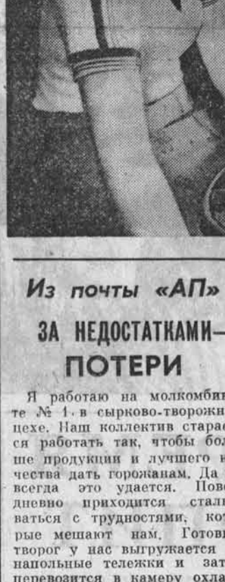
Из почты «АП» ЗА НЕДОСТАТКАМИ — ПОТЕРИ

Правило не приходится. Правильно делают те субпродовольственные организации, которые по мере возможности вводят на объект свои силы.