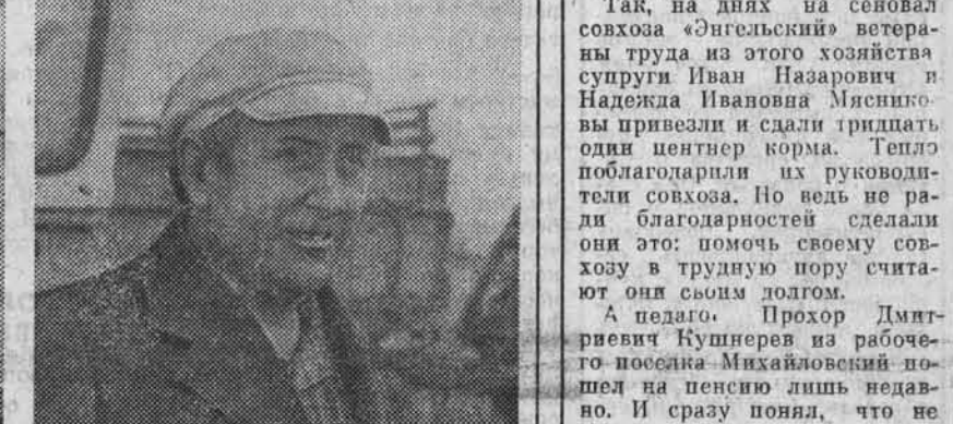
Внимание владельцев личного автотранспорта. ВЫПОЛНИМ СВОЙ ДОЛГ. Заготовка кормов сегодня — главный фронт борьбы за решение Продовольственной программы. Большинство жителей города правильно понимают сложившуюся обстановку и активно включились в зеленую работу. На лугах рядом с сельскими труженниками работают тысячи горожан, сотни автомобилей и другой техники. Их силами в районе пригорода заготовлено 24 тысячи тонн сена и сенажа — более половины задания.