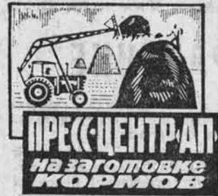
ПРЕСС-ЦЕНТРАП на заготовке кормов