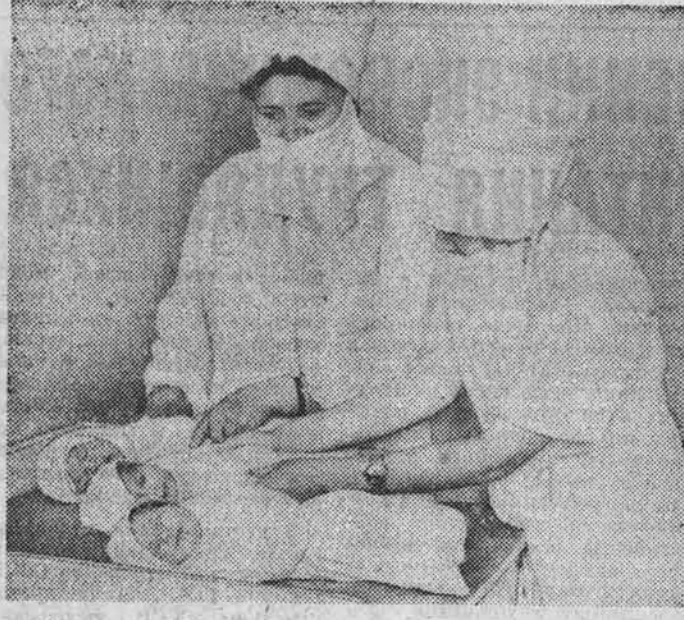
(Окончание. Начало на 1-й, 3-й стр.)