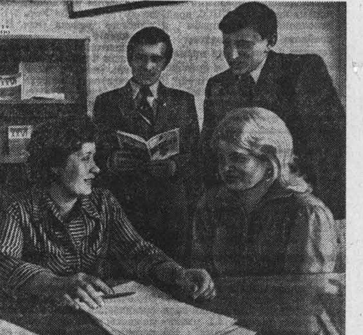
Солонешенский район.

При глубокой пахоте тракторист сегодня нередко отнимает от плуга одна, а то и два корпуса. Тратится на это много времени, а корпус часто в поле теряются. У нашего ПП-6-40 корпуса не надо отнимать. Машинист из кабины трактора регулирует ширину захвата в диапазоне от 1,8 до 2,5 метра. Он может, скажем, добавить не целый корпус, а лишь треть его. И КПД агрегата при этом заметно повышается. Во всех случаях работы с нашим плугом в благоприятных условиях находится двигатель и другие узлы трактора.