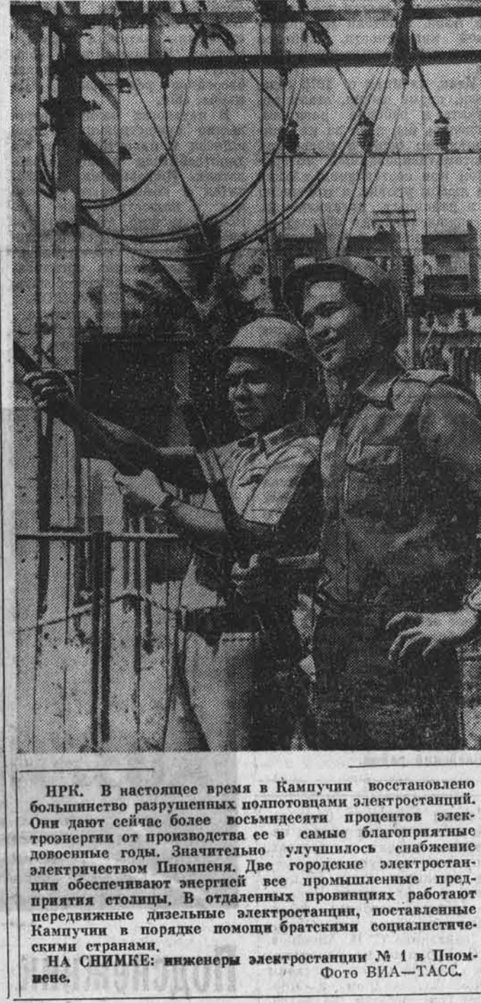
НРК. В настоящее время в Кампучии восстановлено большинство разрушенных полтора десятилетиями электростанций. Они дают сейчас более восьмидесяти процентов электроэнергии от производства ее в стране. Значительно улучшилось снабжение электроэнергией энергией все промышленные предприятия столицы. В отдаленных провинциях работают Кампучии в порядке помощи братскими социалистическими странами. НА СНИМКЕ: инженеры электростанции № 1 в Пном-Пене.