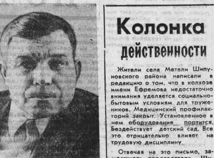
Фото А. Павлушина. Солонешенский район.

Хорошо потрудились животноводы Солонешенского района в минувшем году. За успехи во Всесоюзном социалистическом соревновании район награжден переходящим Красным знаменем ЦК КПСС, Совета Министров СССР, ВЦСПС и ЦК ВЛКСМ. В числе правоохранителей идут совхозы «Солонешенский» и «Сибирячский». В завершающий период зимовки животноводы сосредоточили свое внимание на эко-