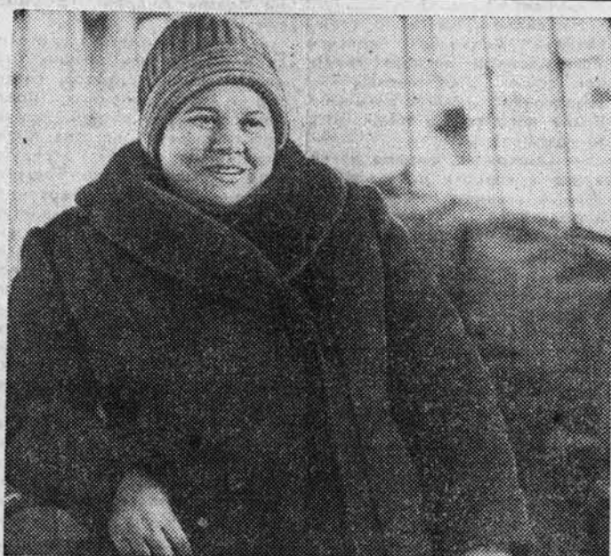
Делегат XVII съезда профсоюзов СССР

ОЧЕНЬ ВАЖНО ПОВСЕОБЩНО УЧЕБНО этот опыт сейчас, когда сельские труженики края, включившись во Всесоюзное социалистическое соревнование по достижению 60-летия образования СССР, активно участвуют в полевых работах второго года да пятилетки, окончательно уточняют севообороты, разрабатывают рабочие планы и графики проведения массовых сельскохозяйственных кампаний. Максимальное внимание при этом следует уделять комплексному освоению земельных участков на основе научных обоснованных систем земледелия. Такие системы, разработанные учеными и специалистами для всех зон Алтай, утверждены крайкомкомом и должны повсеместно стать руководством к действию. Эту работу надо организовать так, чтобы в этом году научно обоснованные почвоведческие системы земледелия были доведены до каждого колхоза и совхоза, всех отделений, бригад, конкретных полей. Для широкой пропаганды следует максимально использовать