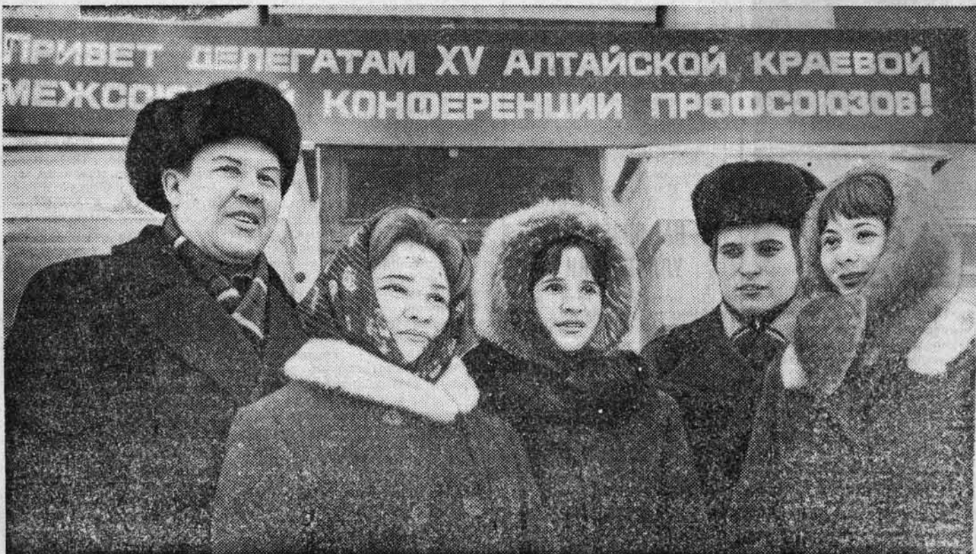
ПРИВЕТ ДЕЛЕГАТАМ XV АЛТАЙСКОЙ КРАЕВОЙ МЕЖСОЮЗНОЙ КОНФЕРЕНЦИИ ПРОФСОЮЗОВ!