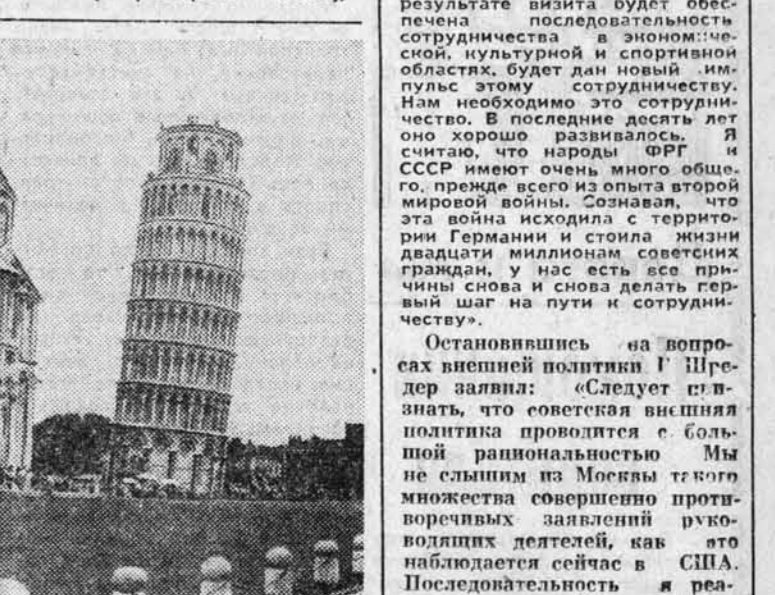
ПИЗА — древний итальянский город, один из наиболее известных культурных и исторических центров области Тоскана, давно привлекает и себе внимание ученых археологов и ценителей искусства со всего света. Именно здесь, на одной из красивейших старинных площадей Пизы — Piazza dei Miracoli (площадь Чудес), расположена знаменитая на весь мир падающая башня, которой более 800 лет.

Год от года растет пропускная способность главных «морских ворот» республики. В течение ближайших пяти лет докеры намерены достигнуть еще более высоких рубежей и обрабатывать за год уже не 15, а около 23 миллионов тонн грузов.