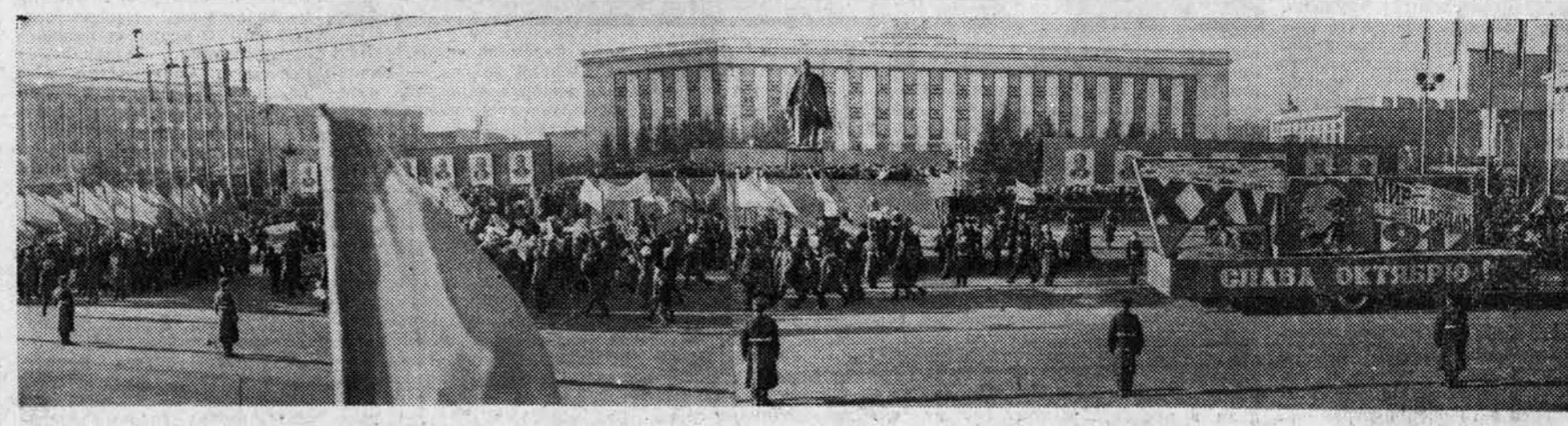
БАРНАУЛ. 7 НОЯБРЯ 1981 ГОДА. ПЛОЩАДЬ СОВЕТОВ. [Отчет о демонстрации смотрите на 2-й стр. газеты].