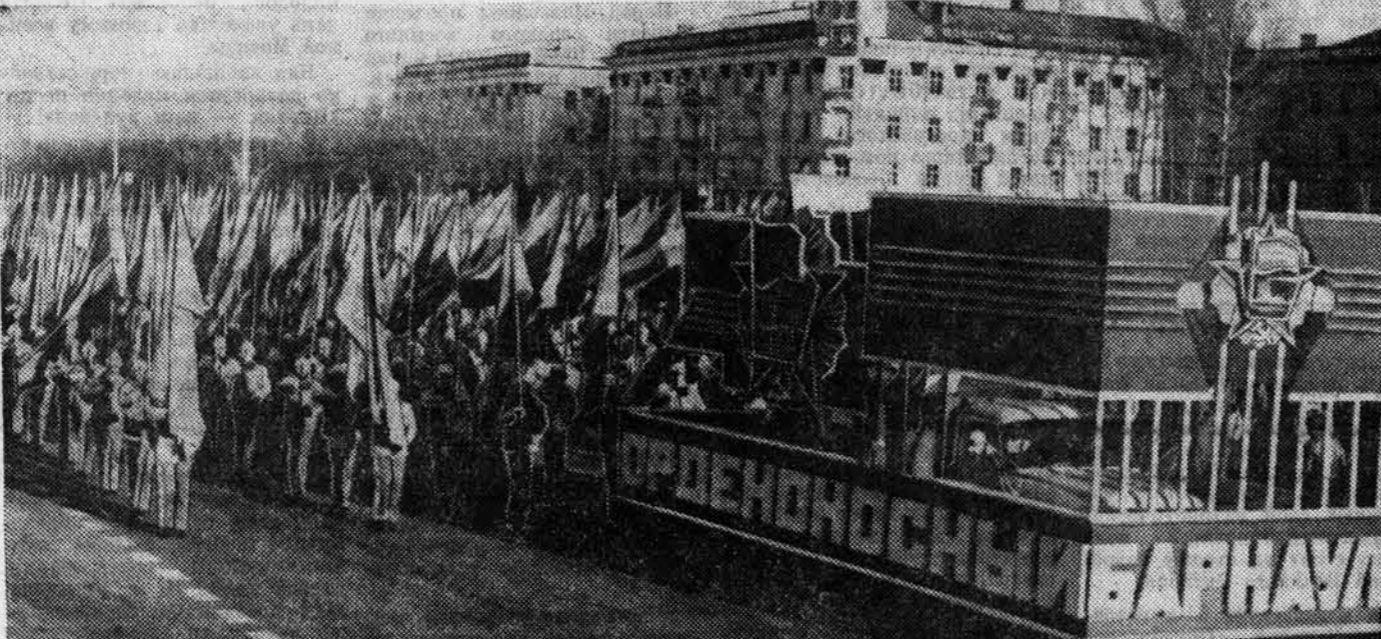
НА СНИМКАХ — В ПРАЗДНИЧНЫХ КОЛОННАХ БАРНАУЛЬЦЕВ. СВЕРХУ ВНИЗ: курсанты авиационного училища; подобные рапорты о помощи горожан селу несут каждый коллектив; ветераны партии, войны и труда открыли манифестацию жителей краевого центра; на площади Советов начинается демонстрация трудящихся орденского Барнаула; юные «бундовцы» — воспитанники профтехучилищ; праздничное настроение у участников шествия; студенты-отрядники возглавляют колонны вузов города.