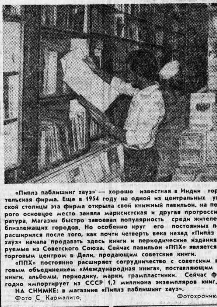
«Пилл паблшинг хауз» — хорошо известная в Индии торговая-издательская фирма. Еще в 1954 году на одной из центральных улиц индийской столицы эта фирма открыла свой книжный павильон, на полках которого основное место заняла марксистская и другая прогрессивная литература. Магазины быстро завоевали популярность среди жителей Дели и близлежащих городов. Но особенно круг его постоянных посетителей расширился после того, как почти четверть века назад «Пилл паблшинг хауз» начала продавать здесь книги и периодические издания, импортные из Советского Союза. Сейчас павильон «ППХ» является основным торговым центром в Дели, продающим советские книги.

За мир и сотрудничество На берегу Тихого океана В районе Западной Лимы, полежащей в зону Чиратского гидроузла, сооружение которого планируется в следующем году, власти ведут борьбу с охотниками за... землей. Они скупают все участки гектаров близ объектов будущей энергостроительной, которая станет крупнейшей на острове. Дело в том, что для создания гидроузла потребуются выкупить у нынешних владельцев около 6.500 гектаров земли, на чем и собираются сыграть спекулянты. Хотя губернатор запретил земельные сделки в этом районе, но и по сей день продолжается охота за земельными участками, которые оформляются с помощью фиктивных «дворянских». Сейчас даже трудно предположить, насколько действия перекупщиков удорожат стоимость проекта, осуществление которого занимает важное место в программе правительства по увеличению производства продуктов питания в стране. А. ЧЕРКИЗОВ, (АПН).