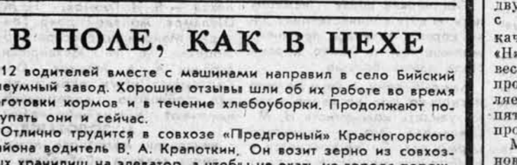
В поле, как в цехе. 12 водителей вместе с машинистом направили в село Бийский олеумный завод. Хорошие отзывы шли об их работе во время заготовки кормов и в течение хлебоуборки.