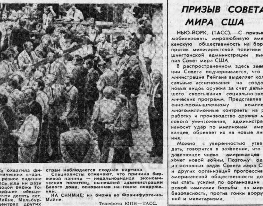
Беспрецедентная лихорадка охватила финансовые центры капиталистических стран.

Советские друзья предостерегли ребят Эль-Аснама, переживших ужасы гражданской войны в Лиане. Они гостеприимно приняли и алжирских ребят.