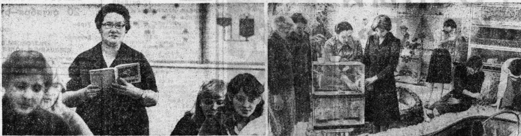
Барнаульскому педучилищу — 60 лет