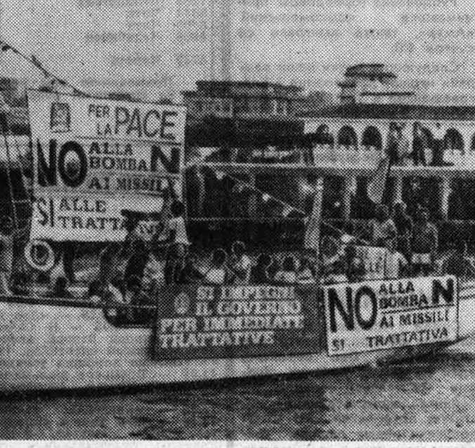
«Корабль мир» — так назвали римские коммунисты судно, совершившее плавание вдоль морского побережья недалеко от итальянской столицы «Нет» — нейтронной бомбе и американским ядерным ракетам) — это лозунг украшали судно, вышедшее из римского пригорода Фьюмичино. НА СНИМКЕ: «Корабль мир», Телерадио АП — ТАСС.

НЬЮ-ЙОРК. (Корр. ТАСС). В обстановке строжайшей секретности в Монреале началось предварительное слушание по делу трех канадских граждан, обвиняемых в нарушении законодательства. В ходе расследования, которое проводилось около года, установлено, что они занимались тайной передачей Пакистану электронного оборудования, которое используется для получения обогащенного урана, который необходим для производства ядерного оружия. Ссылаясь на «запутанность дела», «техническую сложность» рассматриваемых вопросов, а также на то, что в нем затрагиваются детали, о раскрытии которых бы «принести ущерб национальной безопасности» страны, власти тщательно скрывают все материалы следствия и информацию о слушаниях. Пока известно лишь, что обвиняемые — канадцы — признали участие в своих операциях канальскую энергетическую корпорацию «Сарабит» из Онтарио. Через нее осуществлялись закупки электронного оборудования в Соединенных Штатах, после чего оно различными путями переправлялось в Пакистан. Как указывают местные источники, строительство которого находится в стадии завершения близ Исламабада. Комплекс создается в союзе с западными странами и когда вступит в строй, он сможет производить ядерное оружие. По сведениям журнала «Атлантик», Пакистан в состоянии создать свою первую ядерную бомбу уже в ближайшем будущем.