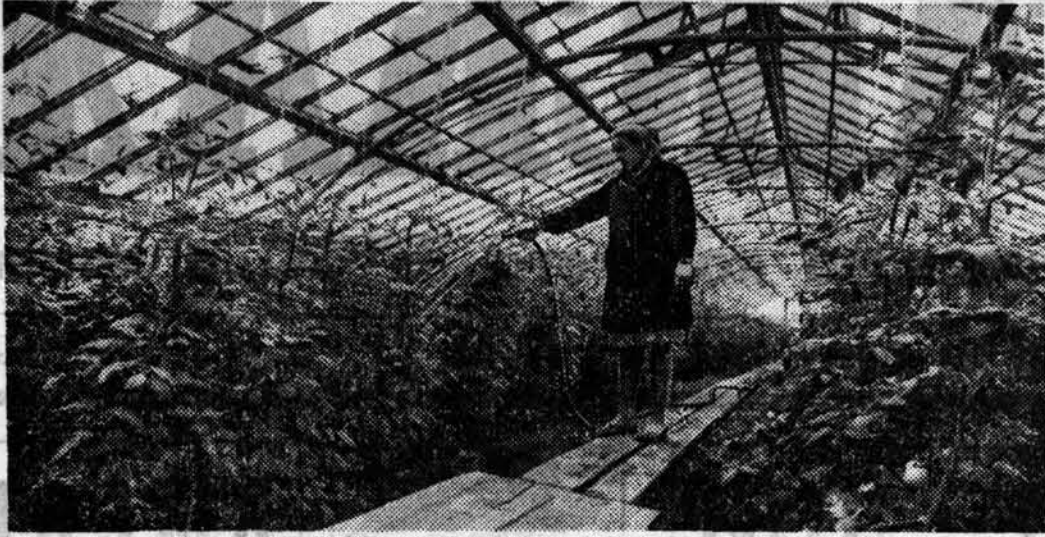
К общему столу — приварок