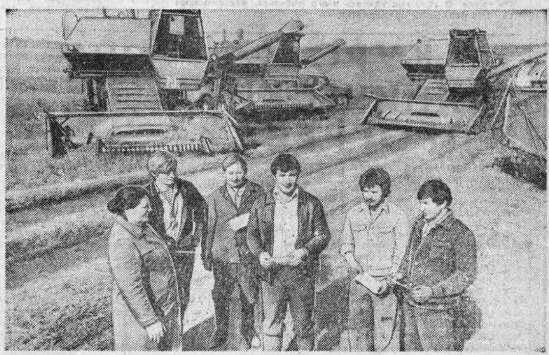
Групповое фото людей