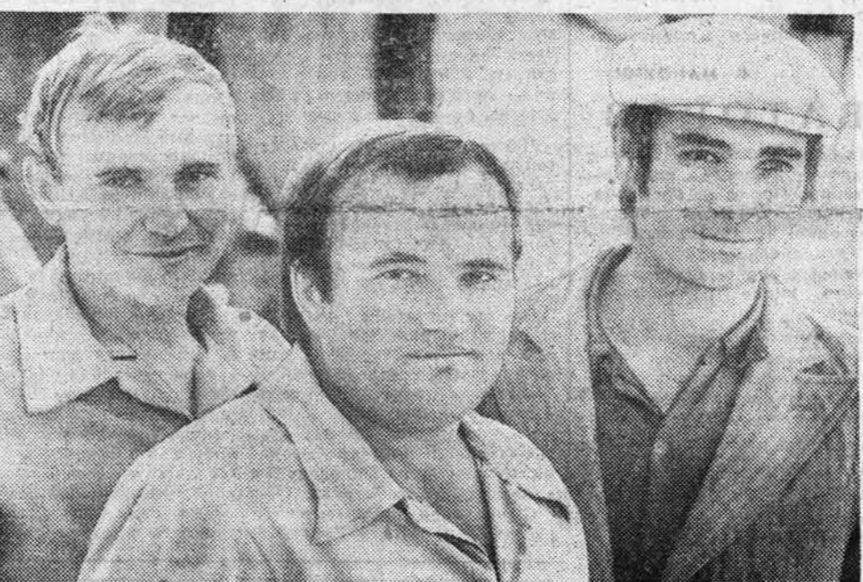
В РОДИНСКОМ РАЙОНЕ на заготовку кормов впереди идет кормозаготовительное звено из совхоза «Память Ленина»...

В КРАЕ ЗАГОТОВЛЕНО СЕНА 1305,2 ТЫСЯЧИ ТОНН — 72 ПРОЦЕНТА, СЕНАЖА 986,6 ТЫСЯЧИ ТОНН — 91 ПРОЦЕНТ, ТРАВЯНОЙ МУКИ 185,7 ТЫСЯЧИ ТОНН — 88 ПРОЦЕНТОВ К ПЛАНУ.