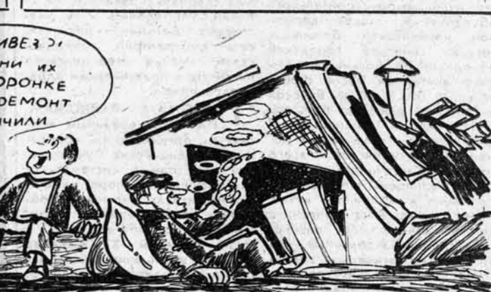
Рис. С. Злобина.

Я. М. Астафьев — 4 сентября, Г. Л. Леднев — 7, В. Я. Малышев — 11, С. Г. Семенов — 14, А. К. Деменин — 18, Я. П. Казин — 21, Д. А. Шестеряков — 25, М. П. Солодовников — 28 сентября. Время приема — с 14 до 18 часов в здании крайпотребсоюза (пр. Ленина, 59, комната 85).