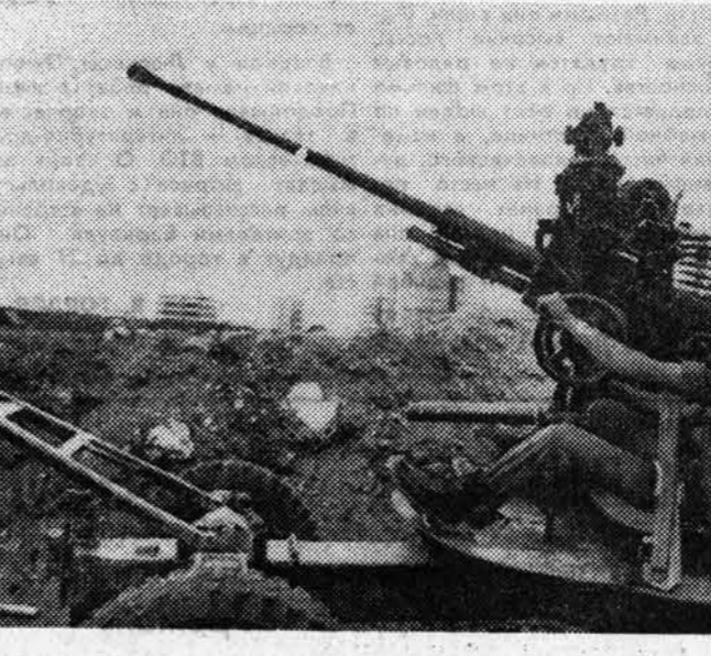
Войска Тель-Авива натгнетают напряженность на юге Ливана, подвергая населенные пункты артиллерийскому обстрелу и налетам авиации.

ПРИЖИ (ТАСС). Иранский ракетный катер «Табарзин», захваченный вооруженной группой противников нынешнего режима в Иране, был отбуксирован сегодня ночью французскими кораблями в район порта Тулон. Накануне, прибыв на рейд Марселя, захватившие катер лица потребовали дозакрывать его топливом, угрожая в противном случае взорвать корабль. После переговоров с французскими властями, отказавшимися удовлетворить это требование, вооруженная группа освободила экипаж «Табарзина». После этого катер был в состоянии самостоятельно передвигаться. Как сообщает агентство Франс Пресс, переговоры с оставшимися на борту катера лицами об условиях их сдачи продолжаются.