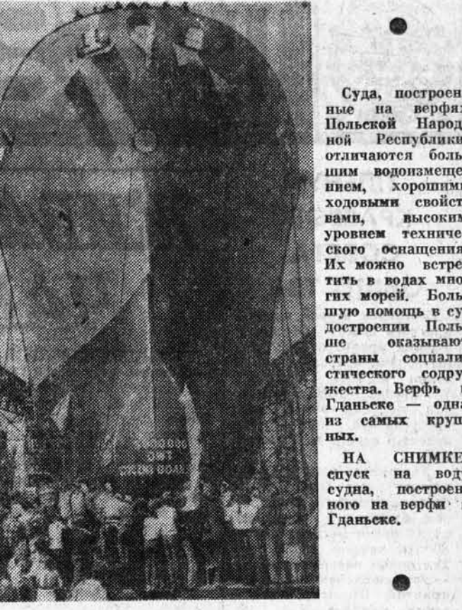
Суда, построенные на верфях Польской Народной Республики, отличаются большим водоизмещением, хорошими ходовыми свойствами, высоким уровнем технического оснащения. Их можно встретить в водах многих морей. Большую помощь в судостроении Польша оказывает странам социалистического содружества. Верфь в Гданьске — одна из самых крупных.

На всем пути траурную процессию сопровождали усиленные наряды полиции и армейские подразделения, готовые по малейшему поводу обрушиться на ее участников. У дубовых воротных стоек были высланы по два монстра на джип, когда возмущенные ирландцы выдвинулись на улицы в знак протеста против жестокой политики английских властей, обрекающей ирландцев на дальнейшее кровопролитие.