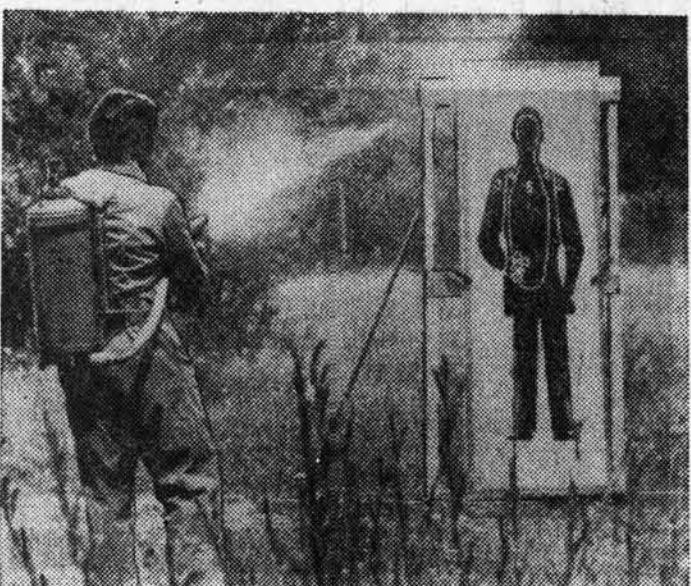
ФТГ. В Дахуа по инициативе баарского министра иностранных дел Тандера проводятся испытания новых средств борьбы против террористов. Демонстрация массовых выступлений, ранее здесь не применявшихся. В числе этих средств, которыми власти намерены оснастить полицию, входит газобразное вещество нервно-паралитического действия «См-35». Это вещество было опробовано американскими войсками в гражданской войне против народа Вьетнама. Недавно полиция Великобритании пустила его в ход при подавлении массовых выступлений молодежи за свои права.

Выделенные ассигнования, однако, представляют лишь малую часть осуществляемых в США программ наращивания милитаристских расходов.