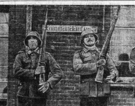
Лицо «свободного мира» ПРИ ПОПУСТИТЕЛЬНОСТИ ВЛАСТЕЙ В США производят активизироваться расисты.

Радиотелевизионный центр «София» Недавно в живописной местности Копито в горах Витоша, близ болгарской столицы, являлась закладка фундамента нового телевизионного центра.