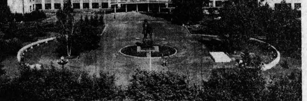
«АЛТАЙСКИЙ ПОЛИТЕХНИЧЕСКИЙ ИНСТИТУТ».

Всего одна запись в его трудовой книжке — привлек в трест «Объединение».