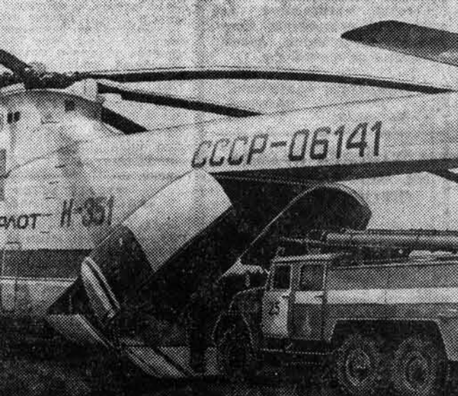
МИ-26 — так называется новый советский тяжелый вертолет. Созданный под руководством главного конструктора М. Н. Тихенко в конструкторском бюро имени М. Л. Миля, он способен перевозить в грузовой кабине и на внешней подвеске грузы весом до 20 тонн.

В коллекции М. Заринова — более 50 работ. Но, несомненно, к началу осенней выставки в Чите она пополнится новыми картинами: ведь все лето художник проводит у седых вершин Удлана.