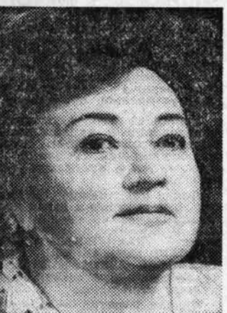
ОЛГА ВИКЛАНДТ, народная артистка РСФСР, лауреат Государственной премии СССР.

Завтра вечером барнаульские зрители встретятся с актерами Московского театра имени А. С. Пушкина. Словом — нашим гостем.