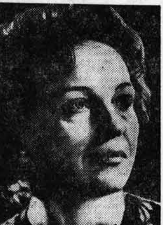
ЛЮДИЛА АНТОНУК, народная артистка РСФСР.

— Со зрительями Барнаула я встречаюсь впервые. Но мне кажется, что эта встреча должна быть интересной. Барнаульцы познакомятся с моей героиней — Старой Хозяйкой Исканюрой в спектакле «Камеиное гнездо» финской писательницы Хеллы Вуолионен.