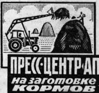
ПРЕСС-ЦЕНТРАЛ На заготовке кормов

Редакция краевых, областных, районных и городских газет, комитету по телевидению и радиовещанию крайисполкома систематически предложено освещать ход социалистического соревнования депутатов местных Советов края, всемерно поддерживать и широко распространять ценные починки и начинания народных депутатов в трудовых коллективах, среди населения избирательных округов.