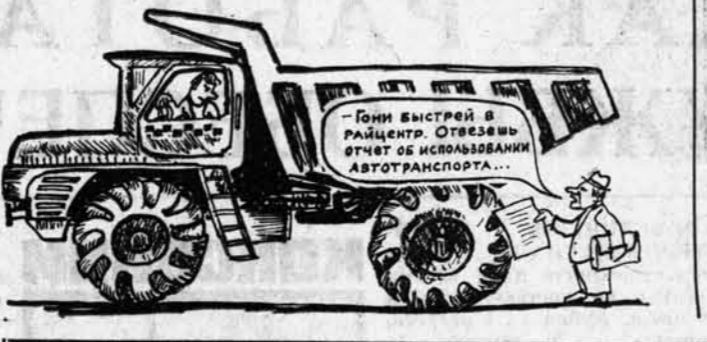
Юни выстрел в район. Отвезет от вас и доставит автопарка...

и постов народного контроля предприятий и организаций.