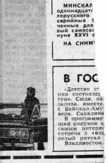
МИНСКАЯ одиннадцатилетняя лорусского серийных 1-х годовых для вей самовывозе ине XXVI с НА СНИМ!

СЕРВИС КОЛХОЗНЫХ станциях. Колхозники, а время прибытия автобуса, заранее могут подготовиться к поездке на базар. Машины, как правило, приезжают прямо к их дворам. Сейчас, например, в разгар «клубничных» и «огуречных» рейсов. На прилавки поступают также свежие помидоры, ранний картофель, черешки. Скоро настанет черед овощных культур. Вниманием окружены хозяйки и по приезде на родские рынки. Здесь о них заботятся работники торговли.