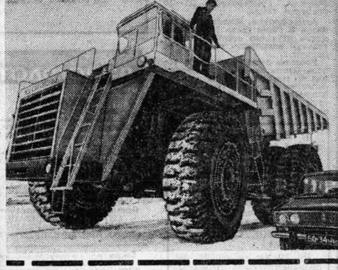
МИНСКАЯ одиннадцатилетняя лорусского серийных 1-х годовых для вей самовывозе ине XXVI с НА СНИМ!

ЖИТЕЛЯМ многих причерноморских сел, чтобы доставить на базар лишние выращенной в личных подсобных хозяйствах продукции, достаточно знать расписание движения специализированного автотранспорта Одесского областного управления колхозными рынками. При нем создана специальная служба сервиса. Раньше доставка товара на рынок для колхозника была сопряжена с немалыми трудностями. Ему самому приходилось искать автомашину, договариваться с грузчиками. Это требовало дополнительных затрат, да и времени отнимало много. Нередко уро-