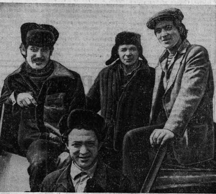
Фоторепортаж ГЛАВНАЯ ЗАДАЧА— КАЧЕСТВО

УКАЗ ПРЕЗИДИУМА ВЕРХОВНОГО СОВЕТА СССР О СОЗЫВЕ ВЕРХОВНОГО СОВЕТА СССР