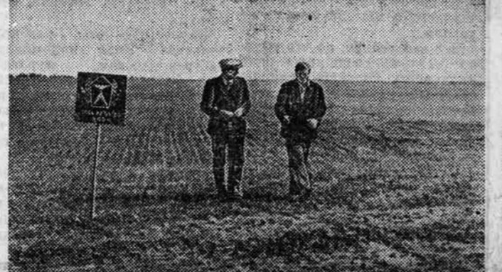
Восенний день, хлебороба трудомок, его напряженный ритм диктуется ритмом страды. Сохраняя землю не может ждать. У многих сельхозников ордена Ленина колхоза «Россия» Змеиногорского района дневная выработка достигает 150—200 процентов.

ЭТО БЫЛО В УБОРКУ прошлого года. Случай из ряда обычных, во многом не характерный. Но из тех, что вызывают боль. У крошки поля стоял пожилой уже человек. Секретарь паркома представил его как руководителя молодежного звена. Разговорились. Да, старенькие ребята. Да, тяга к знаниям, стремление овладеть профессией. А на вопрос: сколько прошло вот таких че-