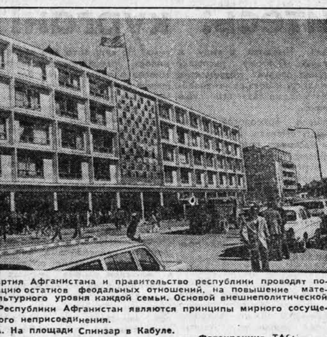
Пародно-демократическая партия Афганистана и правительство республики проводят политику, направленную на ликвидацию остатков феодальных отношений, на повышение материального благосостояния культурного уровня каждой семьи. Основой внешнеполитической деятельности Демократической Республики Афганистан являются принципы мирного сосуществования и политика позитивного несприядничества.

Шеф Пентагона вторично посетил ВМС Дел. Леман, который в беседе с журналистами газеты «Нью-Йорк таймс» изложил программу наращивания военно-морских сил США, предусматривающую увеличение их численности до 600 с лишним боевых кораблей. Он прямо заявил, что Соединенные Штаты преследуют цель навязать Советскому Союзу военно-морские вооружения. В воинственном угаре Леман дошел до того, что провозгласил право США на господство на морях.