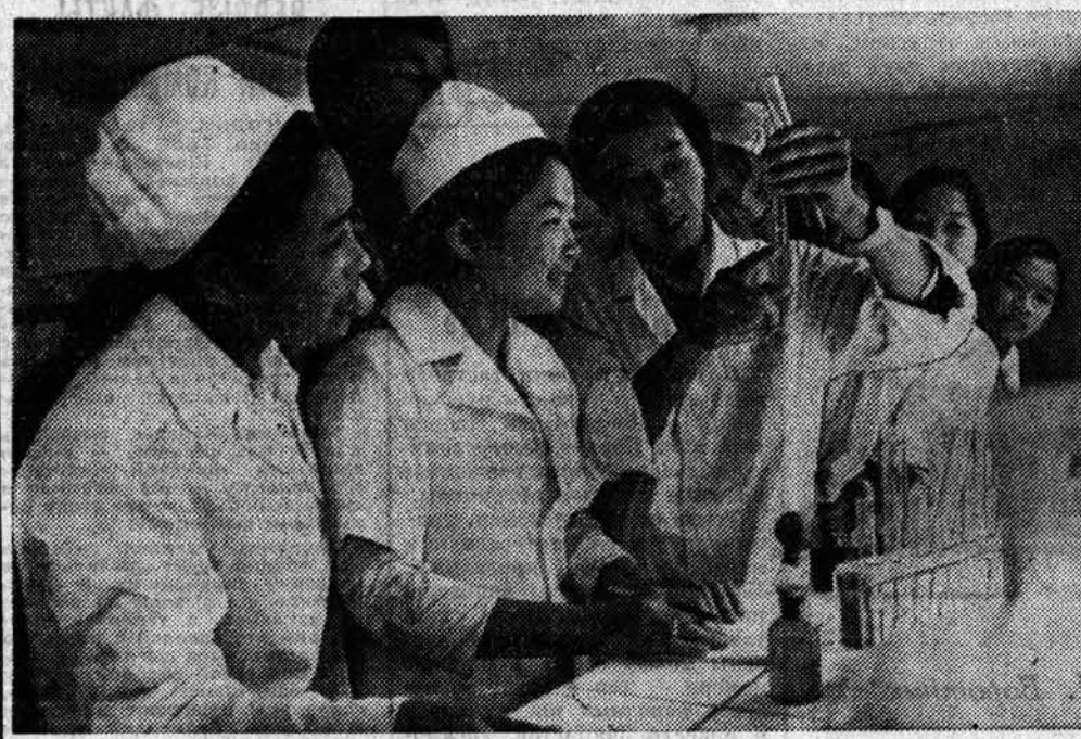
В Лаосе успешно решается проблема здравоохранения. Сравнительно недавно в стране насчитывалось лишь несколько десятков квалифицированных врачей...