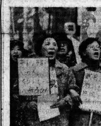
Кровавые преступления хунты

В странах социализма... В начале века, когда завод был создан, он производил простейшие манометры. А сейчас здесь выпускаются телемеханическое оборудование для газохранилищ и насосных станций, сложные электронные системы, которыми оборудуются современные газопроводы, приборы для автомобилей и, в частности, приборный щиток для «Жигулей».