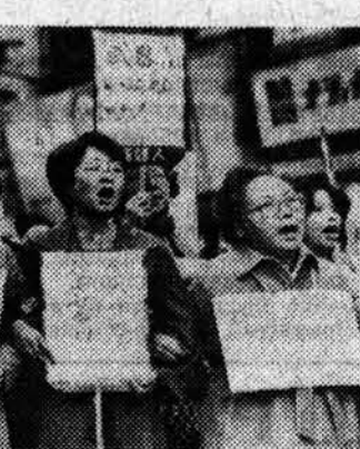
Кровавые преступления хунты

САН-ХОСЕ. (ТАСС). Становятся известными новые факты варварской расправы сальвадорской и гондурасской военными, подстрекаемой Соединенными Штатами, над сальвадорскими беженцами близ границы с Гондурасом. По свидетельству государственного координационного комитета солидарности с народом Сальвадора, 300 мартовцев хунты и 200 солдат гондурасской армии расправились над 7 тысячами беженцев — стариками, женщинами и детьми. Последние были танком подвергнуты обстрелу с американских вертолетов. Имеются многочисленные жертвы.