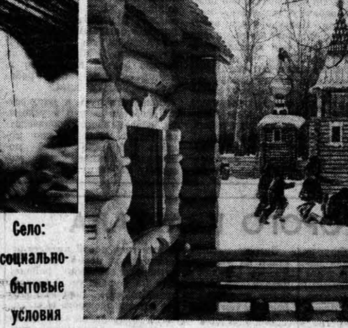
Село: социально-бытовые условия