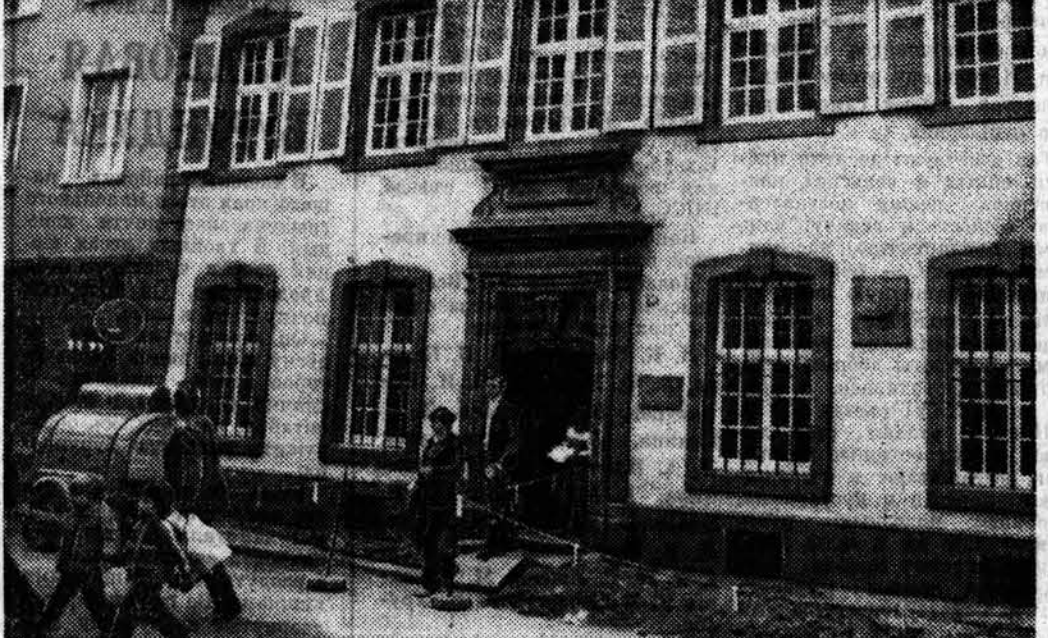
ФРГ. Трир, расположенный на реке Моель в западногерманской земле Рейнланд-Ифальц. Известен во всем мире как родина Карла Маркса. Здесь он родился 5 мая 1818 года, в 1830—1835 годах учился в местной гимназии. Город, насчитывающий сейчас 100 тысяч жителей, посещает много туристов. Они приезжают, чтобы побывать в музее основоположника научного коммунизма на улице Брюкенштрассе, посмотреть на другие достопримечательности Трира, основанного еще до нашей эры и являющегося, согласно хронике, самым старым поселением на немецкой земле.

В опубликованном здесь коммюнике министерства безопасности Мозамбика подчеркивается деятельность шпионов в Мозамбике. В коммюнике содержится призыв к народу Мозамбика усилить революционную бдительность против подрывных прожектов империалистических сил и их пособников.