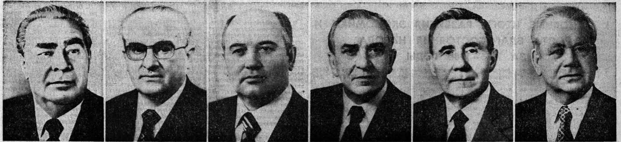
Л. И. Брежнев. Член Политбюро ЦК КПСС, Генеральный секретарь ЦК КПСС. Ю. В. Андропов. Член Политбюро ЦК КПСС. М. С. Горбачев. Член Политбюро ЦК КПСС, секретарь ЦК КПСС. В. В. Гришин. Член Политбюро ЦК КПСС. А. А. Громыко. Член Политбюро ЦК КПСС. А. П. Кириленко. Член Политбюро ЦК КПСС, секретарь ЦК КПСС.