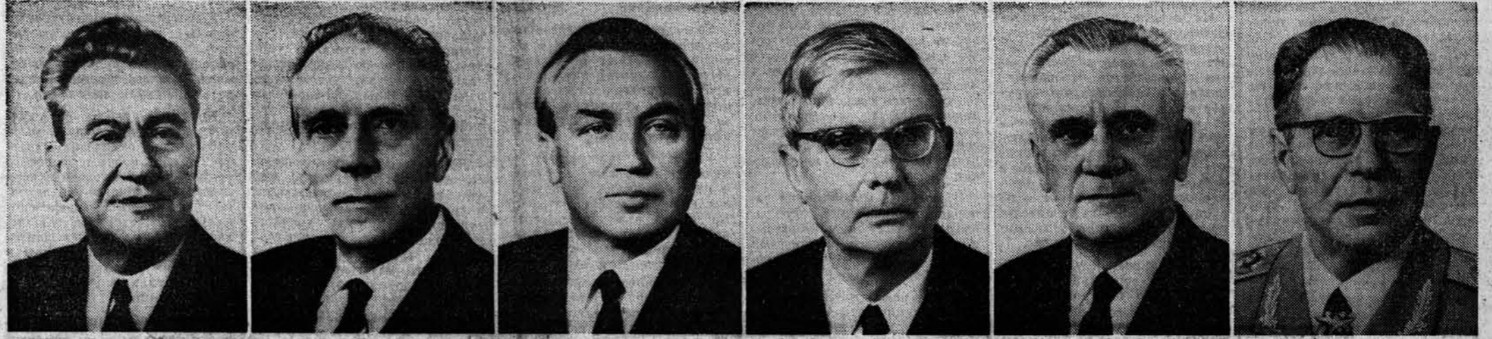
Д. А. Кунаев. Член Политбюро ЦК КПСС. А. Я. Пельше. Член Политбюро ЦК КПСС, председатель ЦК при ЦК КПСС. Г. В. Романов. Член Политбюро ЦК КПСС. М. А. Суслев. Член Политбюро ЦК КПСС, секретарь ЦК КПСС. Н. А. Тихонов. Член Политбюро ЦК КПСС. Д. Ф. Устинов. Член Политбюро ЦК КПСС.