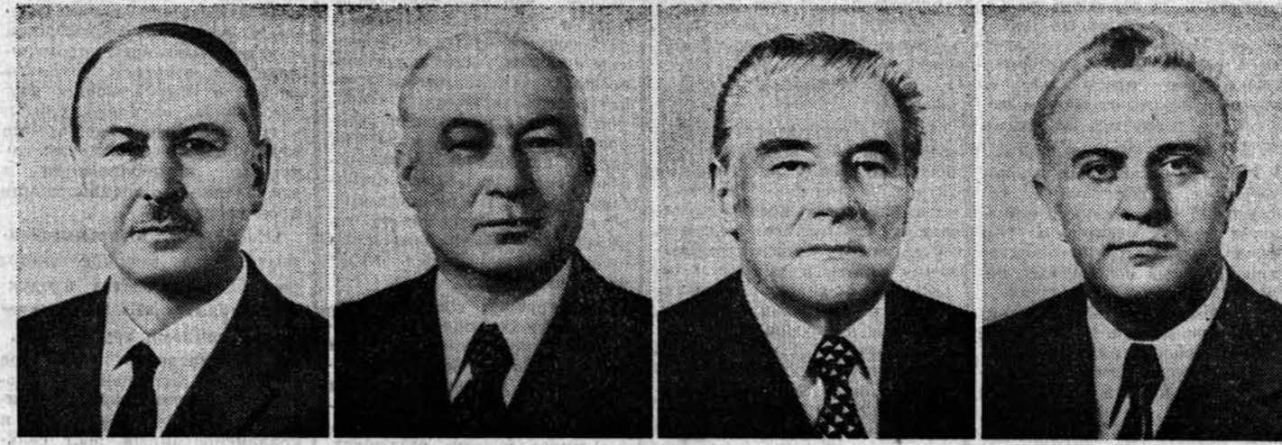
Б. Н. Пономарев. Кандидат в члены Политбюро ЦК КПСС, секретарь ЦК КПСС. Ш. Р. Рашидов. Кандидат в члены Политбюро ЦК КПСС. М. С. Соломенцев. Кандидат в члены Политбюро ЦК КПСС. Ж. А. Шеварднадзе. Кандидат в члены Политбюро ЦК КПСС.