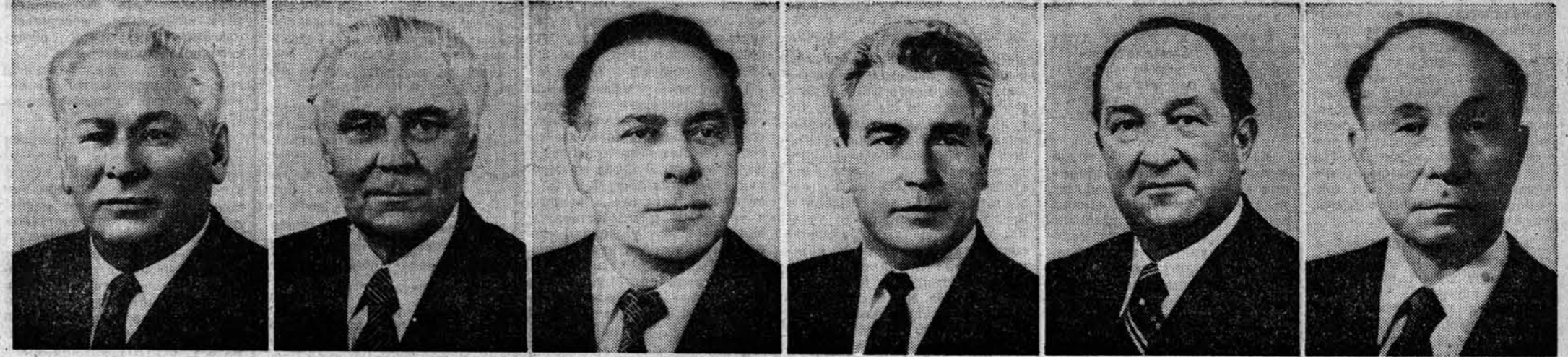
К. У. Черненко. Член Политбюро ЦК КПСС, секретарь ЦК КПСС. В. В. Щербатский. Член Политбюро ЦК КПСС. Г. А. Алиев. Кандидат в члены Политбюро ЦК КПСС. П. Н. Демичев. Кандидат в члены Политбюро ЦК КПСС. Т. Я. Киселев. Кандидат в члены Политбюро ЦК КПСС. В. В. Кузнецов. Кандидат в члены Политбюро ЦК КПСС.