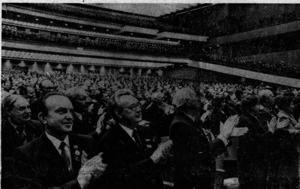
НА СНИМКЕ: в зале заседания XXVI съезда КПСС.