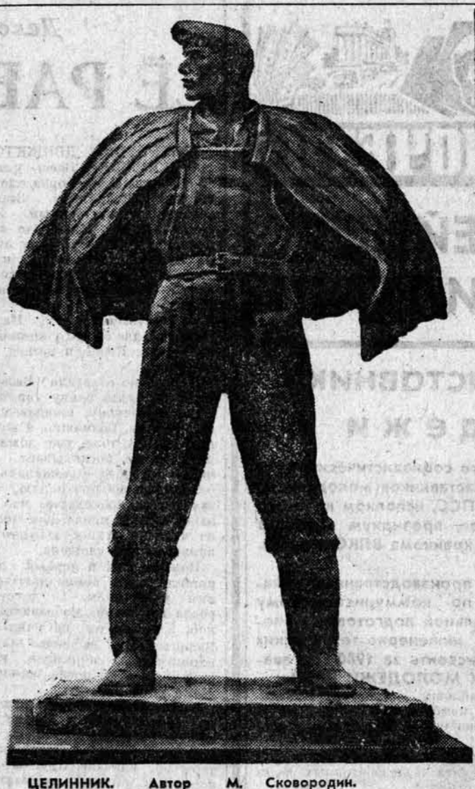
ЦЕЛИННИК. Автор М. Сквородин.

Пять километров — на столько увеличится протяженность ливневой канализации. Новых же линии пройдут по улицам Новой, Юрина, Попова, Смирнова и другим.