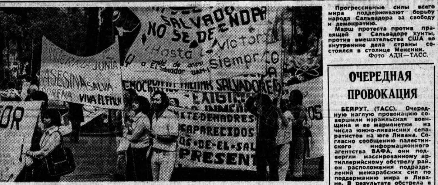
Прогрессивные силы всего мира поддерживают борьбу народа Сальвадора за свободу и демократию. Марш протеста против правящей в Сальвадоре хунты, против вмешательства США во внутренние дела страны состоялся в столице Мехико.

ПРАГА. Смелый проект осуществляют чехословацкие гидротехники — они переносит на новое место озеро Држинона на севере Чехии, в районе крупнейшей в стране буровых разработок. Дело в том, что угольные карьеры вплотную подошли к этому водохранилищу, на дне которого геологи обнаружили мощные пласты топлива. Было решено начать разработку месторождения. Вместе с программой его освоения специалистами составлен проект создания неподалеку от Држинона новой гидросистемы из трех водоемов, которые вместят воды старого озера.